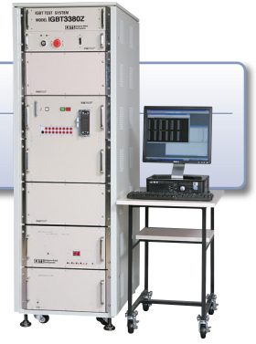
Power area of high voltage supply (高圧電源パワーエリア)