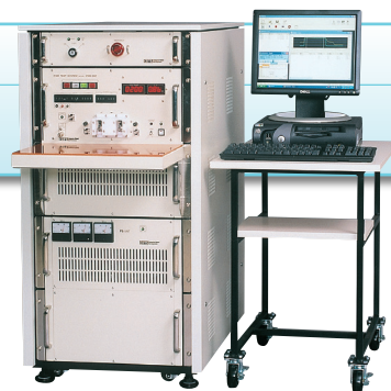
Fundamental Test Circuit